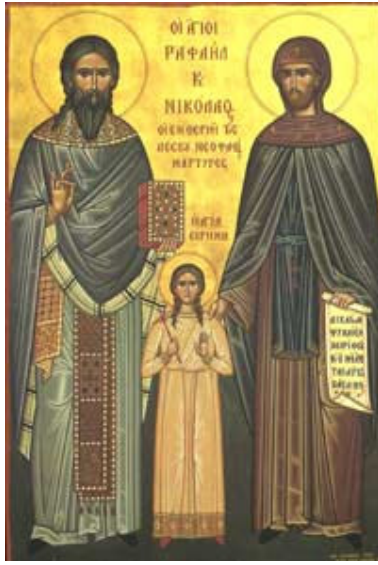
القديسون روفائيل وإيريني ونيقولاوس (يعدّ لهم في 9 نيسان)

جواب: في الكنيسة الأرثوذكسية لا سعي لإثبات القداسة كما هي الحال في الغرب. التكريم يأتي أولاً من شعب الله، أي المؤمنين. كل ما تفعله الكنيسة هو الاعتراف بالحاصل وإعطاء صفة رسمية لممارسة قائمة. والمستشهدون في سبيل الإيمان، يأتي تكريمهم مباشرة بعد الشهادة.