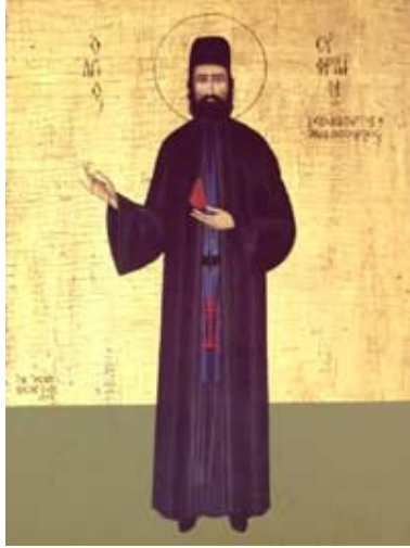
القدّيس أفرام (يُعيّد له في 5 أيار)

لوحظت شفاعاة القدّيسين منذ مطلع القرن الثاني. فبعد استشهاد القدّيس اغناطيوس المتوشح بالله، عاد الذين شهدوا استشهاده إلى بيوتهم. وقد رآه عدد منهم في نومه، فبارك عليهم وسمعه يصلي من أجلهم. شفاعاة القدّيسين هي حقيقة. في التسعينات من القرن العشرين، في الولايات المتحدة الأميركية، كان هناك شاب يتعاطى المخدرات يحتضر بسبب جرعة مميتة تناولها. على طاولته بجانب السرير كان يوجد كتاب الإنجيل. تناول الشاب الكتاب وناجى ربّه بصرخة يأس كبيرة، فظهر له شخص بحلّة سوداء ولحية طويلة. تكلم معه هذا الرجل مطوّلاً وطمأنه وهذاه. لم يعرف الشاب سوى أن اسم هذا الشخص هو أفرام. وقد نجا الشاب من الموت وأخذ يبحث عن هذا الزائر السريّ الذي انتشله من الظلمات. فاستبان له أن القدّيس أفرام الظاهر حديثاً هو إياه الراهب الذي أتى لتعزيتته. اهتدى الشاب وصار أرثوذكسياً. يُذكر أنّ القدّيس أفرام هو راهب شهيد من العام 1425 أظهر نفسه عام 1950 لراهبة وكشف لها من هو وأين استشهد. يستريح جسده في نيا ماكري في أتيكا.