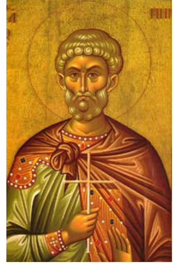
القديس ميناوس المصري (يُعيّد له في 11 تشرين الثاني)