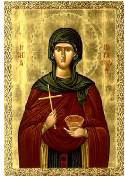
القديسة براسكيبي (يُعيّد لها في 26 تموز)

في معظم الشفاعات المرجَّح أنّ أحدهم قام بطلب مساعدة قديس لمشكلة معيّنة، وعندما استجيبت طلبته، ذاع الخبر، وشيئاً فشيئاً، أصبح القديس "مخصصاً"!!! ولكن رحمة الله كبيرة والصلة التي نقيمها مع القديسين ليست سطحية أو عقلانية، بل هي علاقة حقانية. صداقة القديسين قوية ووفية ومعاشرتهم تعلمنا أنه يمكننا أن نطلب شفاعتهم من أجل كل آلامنا... عرف القديسون على الأرض أنّ المسيح حاضرٌ في كل واحد من إخوتهم، أحببهم بالحب الذي أظهره لهم المسيح. وهم، قرب المسيح، يشهدون أيضاً لحبهم له ويكملون عملهم الذي هو على الأرض. "كل الآباء الذين رقدوا قبلنا يسندوننا بصلاتهم. همم خلاص الإنسان ويساعدوننا بشفاعتهم لدى الله" (أوريجنس).