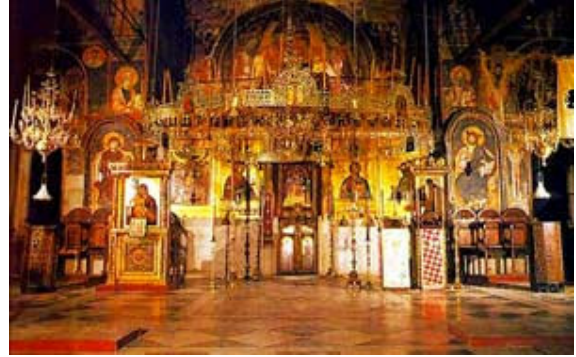
إيقونستاس كنيسة البروتاتون في كارييس - جبل آثوس

من يدخل إلى الكنيسة الأرثوذكسية يجد نفسه محاطاً بإيقوناتٍ للرب يسوع ولعدد من القدّيسين. تكريم القدّيسين حيّ في العالم الأرثوذكسي. هناك عدد من هؤلاء القدّيسين مشترك مع الكنيسة الكاثوليكية (القدّيسون الذين يعودون إلى ما قبل الإنقسام في القرن 11)؛ زاد عليهم عدد كبير منذ ذلك الحين إلى يومنا هذا- بخاصة الشهداء الجدد الذين يعودون إلى الكنيسة الروسية في حقبة الإضطهاد الشيوعي.