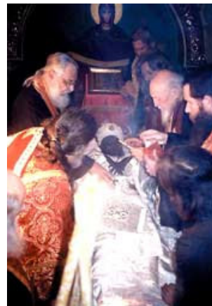
رفات القديس يوحنا مكسيموفيتش الغير المنحلة