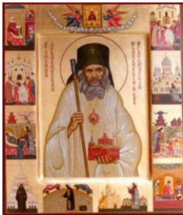
إيقونة القديس يوحنا مكسيموفيتش (يعيد له في 2 تموز)

جواب: يبدو أن "التباله من أجل المسيح" خاصة أرثوذكسية. الـ"يوروديفي" (Yourodiviy) في اللغة الروسية أو "سلوي" في اللغة اليونانية هو نمط قداسة خاص بالكنيسة الأرثوذكسية. تخلي هذا النوع من القديسين عن هذا العالم هو تخل جذري. المتبالهون من أجل المسيح يتخلّون عن كل شيء، وتخليهم كبير لدرجة أنهم يدعون الجنون ويبدون ازدياء بالمظاهر واللياقات، وهم لا يهتمون بشيء إلا بملكوت الله. عزلتهم عن المنطق البشري و"جنونهم" ليس سوى تسبيح متواصل لله. يظهرون بسيط العقل، ولكن لهم بصيرة أقوى من حكماء العالم، وتحت قناع الجنون المؤلم، يفضحون عيوب المجتمع الذي يعيشون فيه، وفي بعض الأحيان يستردون المتسلطين إلى الصواب. هناك قول للقديس بولس يصف فيه هذا النوع من النسك: "لا يخدعن أحد نفسه. إن كان أحد يظن أنه حكيم بينكم في هذا الدهر فليصر جاهلاً لكي يصير حكيماً" (1 كور 3:18). لكن التباله من أجل المسيح صليب ثقيل ولا يتّخذه إلا الأقوياء في الروح.