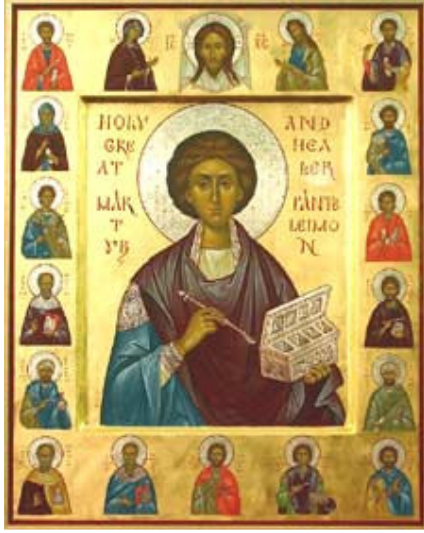
القدّيس بندالييمون (يُعيّد له في 27 تموز) وحوله القدّيسون العادمو الفضة

جواب: هذه لائحة القدّيسين العادمي الفضة. هؤلاء القدّيسون كانوا أطباء يطببون الناس من دون مقابل. لائحتهم مأخوذة من إيقونة يونانية شعبية. الأكثر شهرة بينهم القدّيس بندالييمون (بندالييمون الذي من الشرق) والقدّيسان قزما وديميانوس. في هذه اللائحة يوجد أيضاً القدّيس أوبريببوس (المعروف بأفتروبيوس - كما يسميه الأب القدّيس يوستينوس بوبوفيتش في كتابه عن حياة القدّيسين) وهو لم يكن قدّيساً عادم الفضة ولكنه تكبّد شهادتهم. العادمو الفضة كان لهم في الغرب مكانة القدّيسين الشافين في الشرق. من جهة أخرى بعضهم ينتمي لكلا الفئتين.