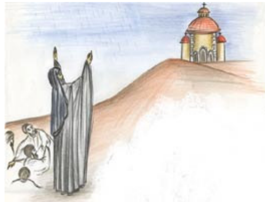
القديس أنثيموس يصلي للمطر... فيهطل بغزارة وهكذا يبني الدير

وبالفعل، صليّ القديس، كما صليّ إيليا قديماً، فأرسل الله المطرَ بغزارة. فرح أهلُ الجزيرة بما جرى فرحاً عظيماً، وأرادوا أن يقدموا لله تقديماً يعبرون فيها عن شكرهم. فجاءوا إلى أنثيموس وقالوا له: "ماذا تريدنا أن نعمل؟ نحن